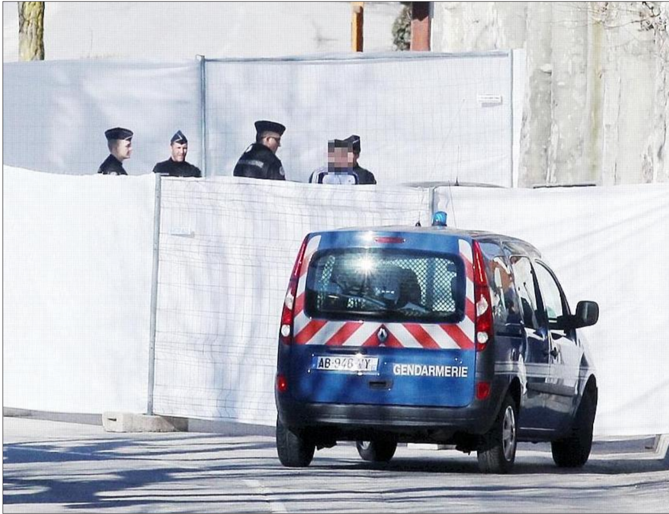
Hier matin, s'est déroulée la reconstitution du coup de feu tiré le 27 mai 2013 quartier Salados en parallèle de la route nationale 94 ; derrière des bâches, spécialement posées à cet effet par souci de "tranquillité" et de "sérénité", indiquait le parquet.

Hier matin, les habitants de Chorges ont vu leur village quadrillé par les forces de gendarmerie. C'est en effet ce jeudi que s'est déroulée la reconstitution de la scène de crime du 27 mai 2013.